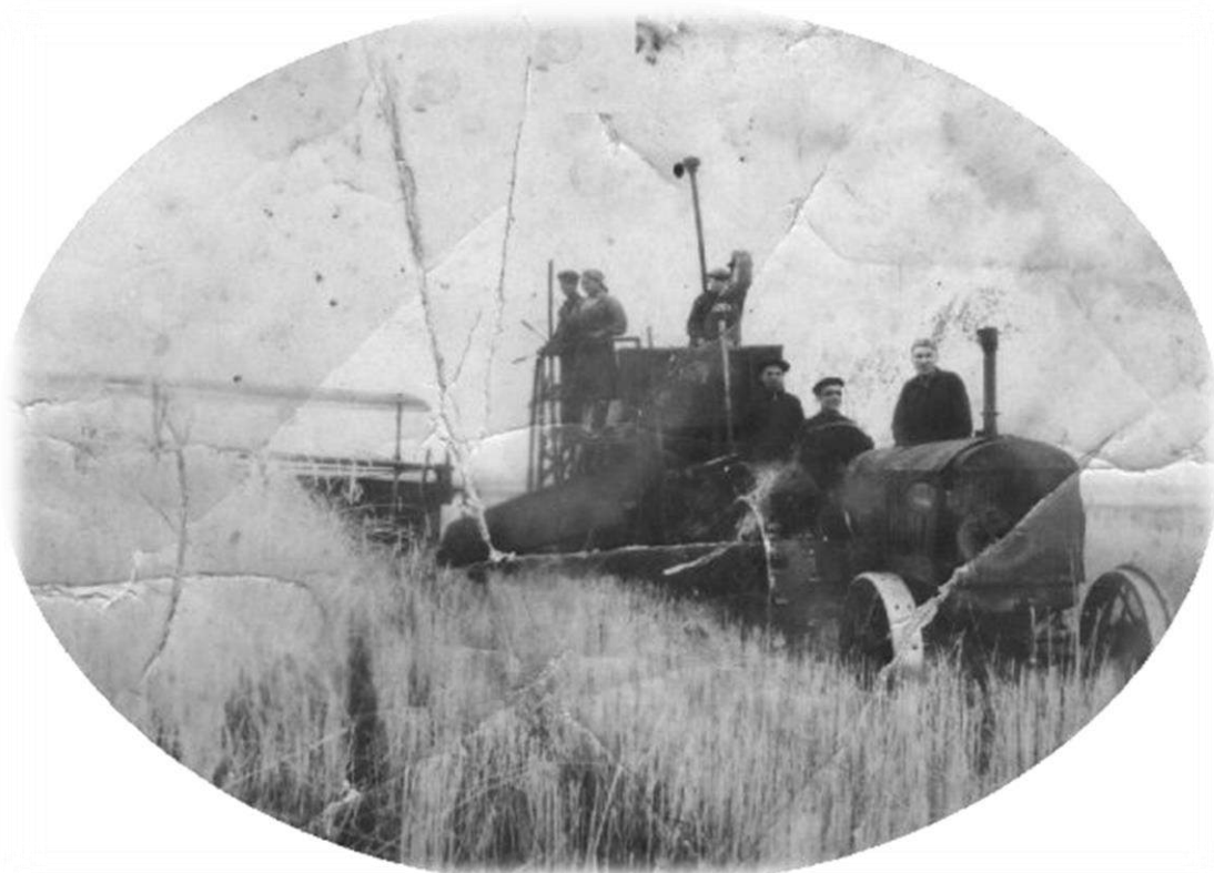
Фото: уборка 1930-х годов в колхозе «Красный партизан»