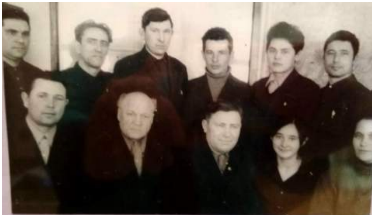
Специалисты колхоза «Маяк», 1972 год.