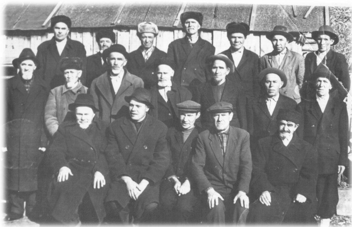
Колхозники колхоза «Коммунизм», 1967 г.