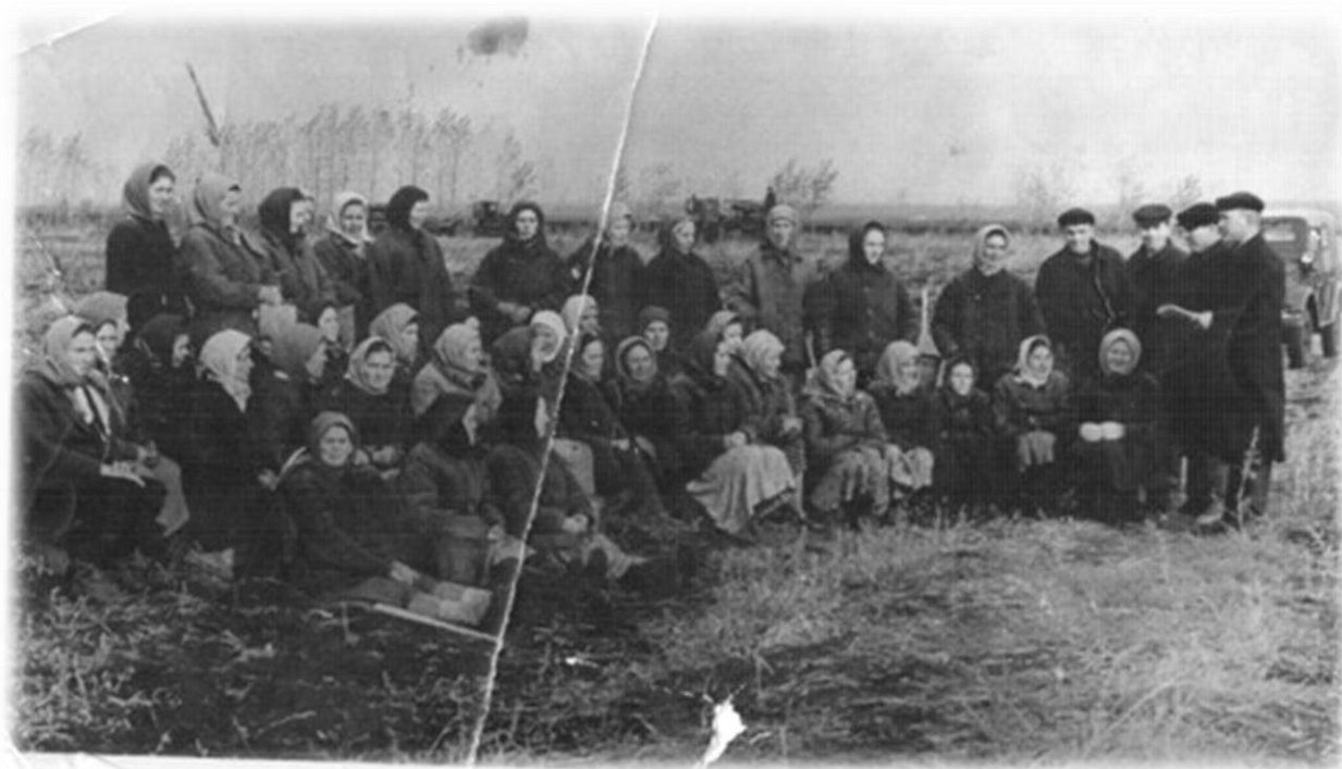
Сбор картошки на поле колхоза «Коммунизм» Ибрагимовская бригада, 1965 год