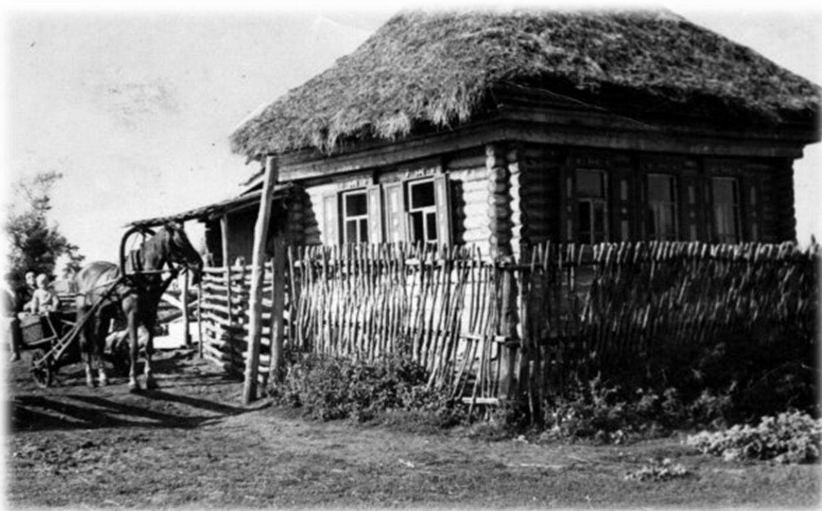
Крестьянская изба с. Ибрагимово 50-60 годов.на тарантасе маленький Габбасов Фарит