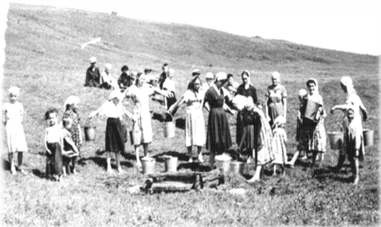
«Тугай чишмэсе», с. Ибрагимово, 1962 год