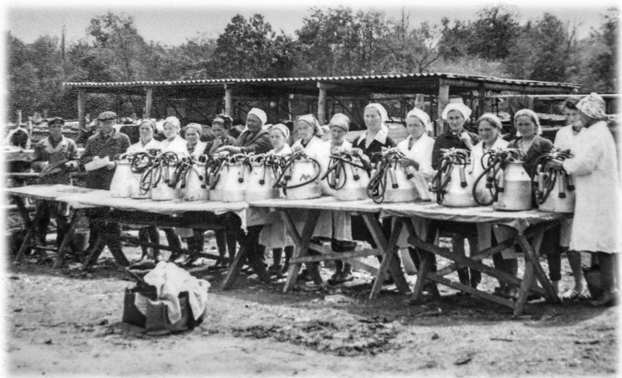
Операторы Ибрагимовской МТФ готовятся к соревнованию