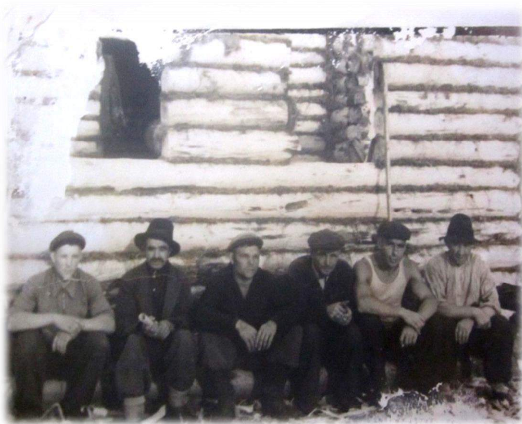
Строительный отряд колхоза «Коммунизм», 1965 год