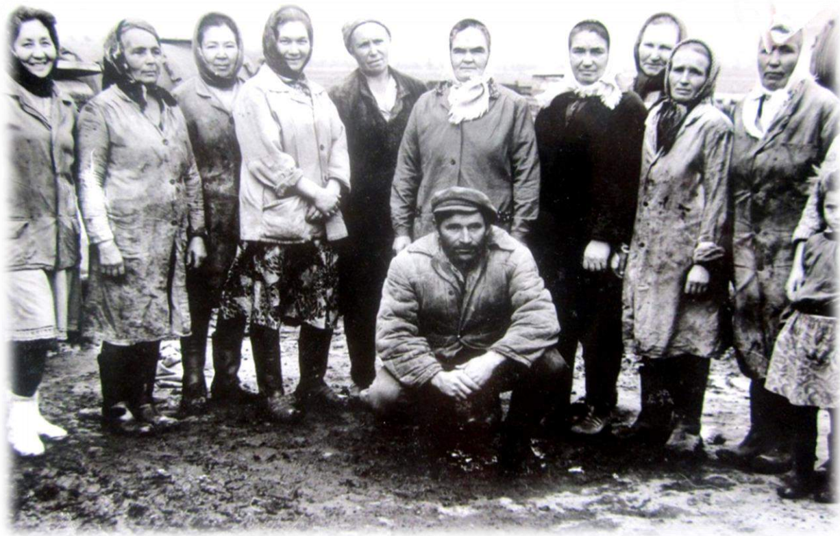
Доярки колхоза «Коммунизм», 1989 г.