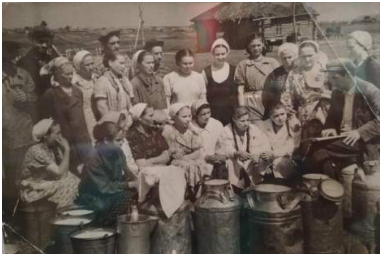
Бикеевская ферма колхоза «Маяк», 1970 год