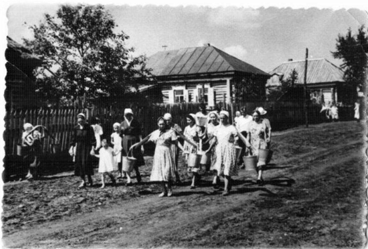
с. Ибрагимово, ул. Почтовая, 1965-70 гг.