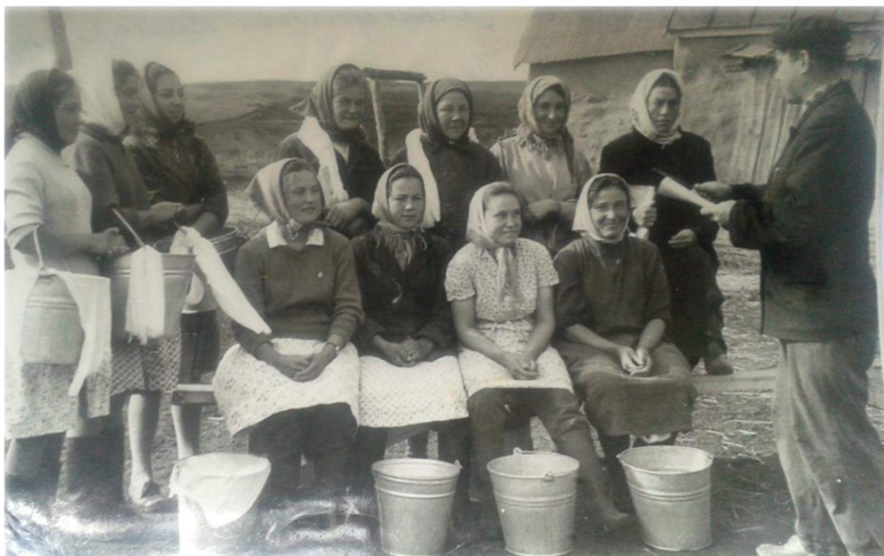
На молочной ферме, д. Абраево