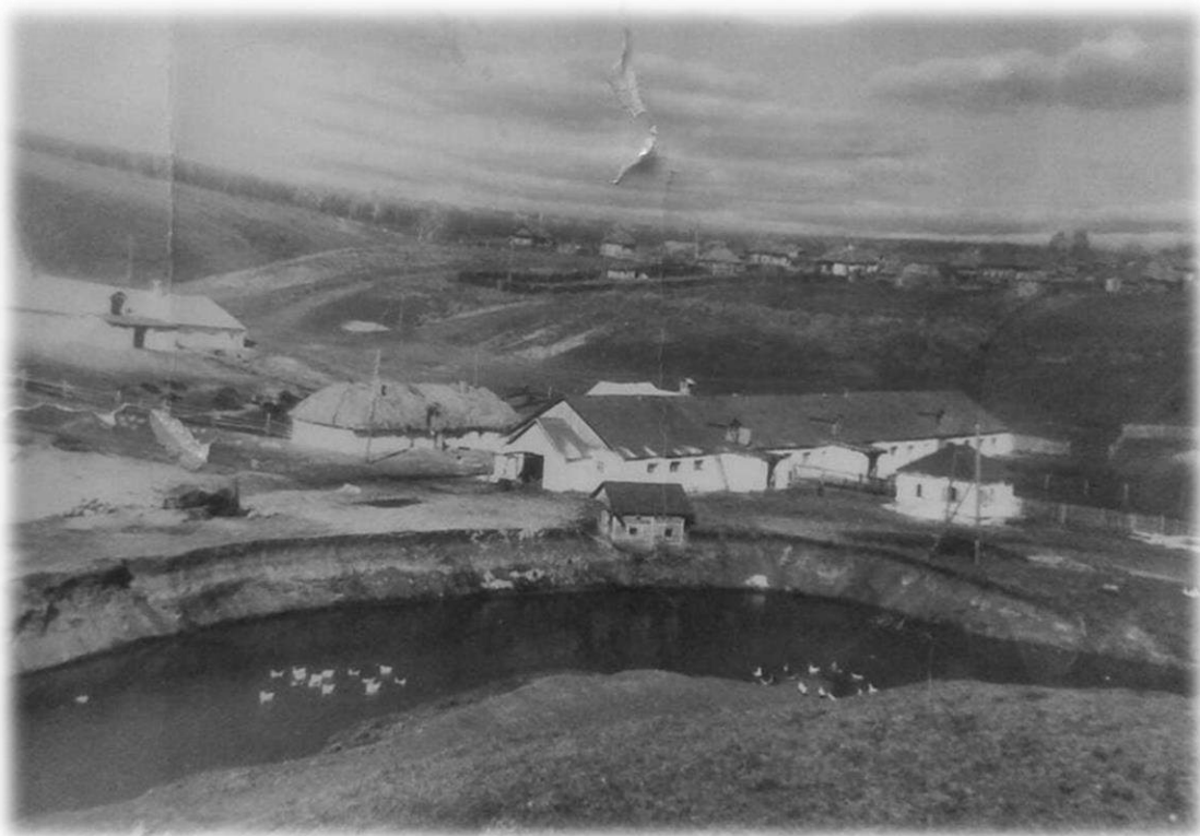
Вид на ферму, д. Абраево, 50-е годы.